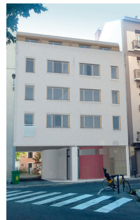
Rue Colbert >