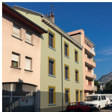
Rue Buffon ^

L'objectif ? Améliorer les performances thermiques, la sécurité et le confort global des résidences.